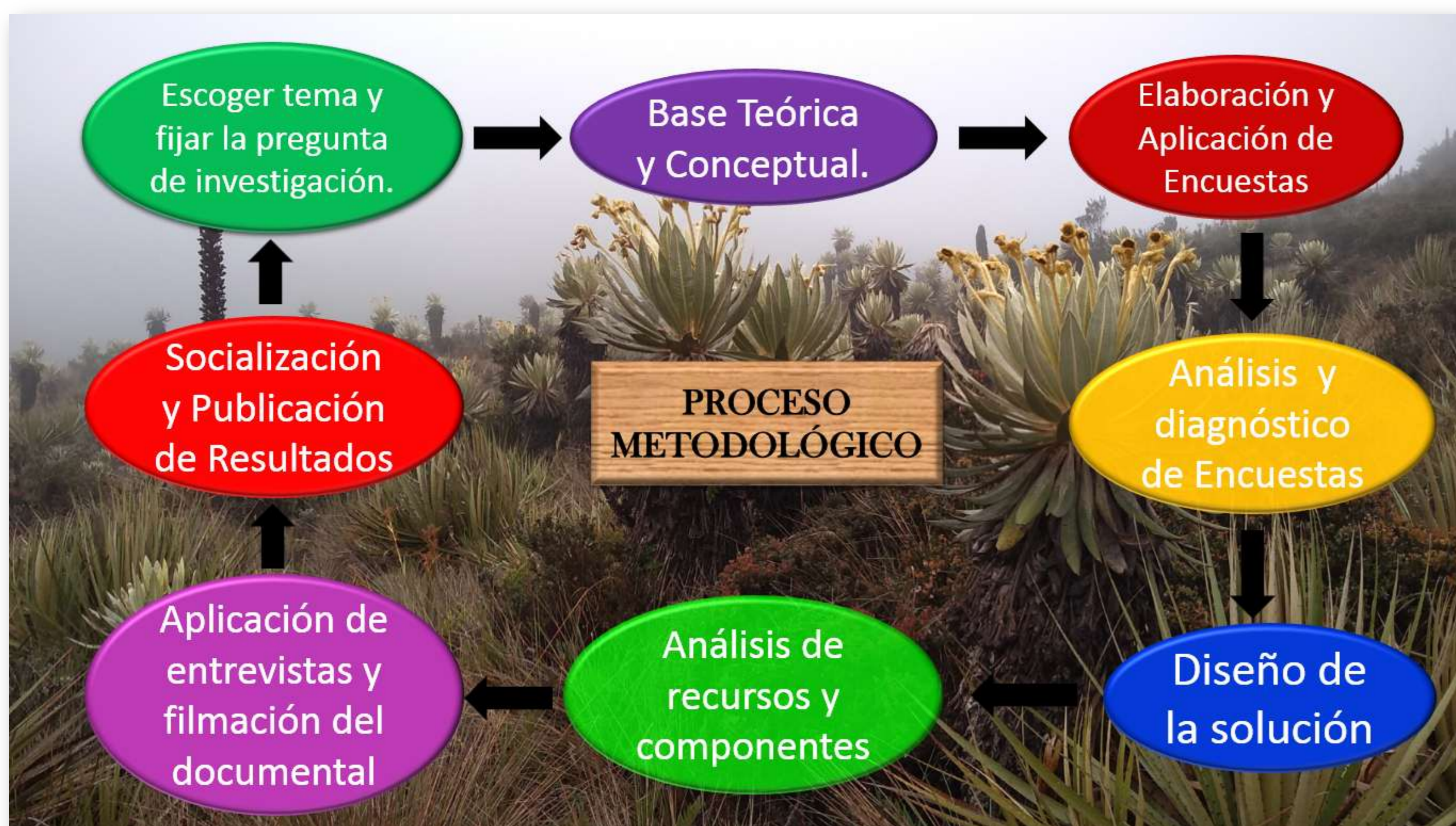
Figura 2. – proceso metodológico de la Investigación.