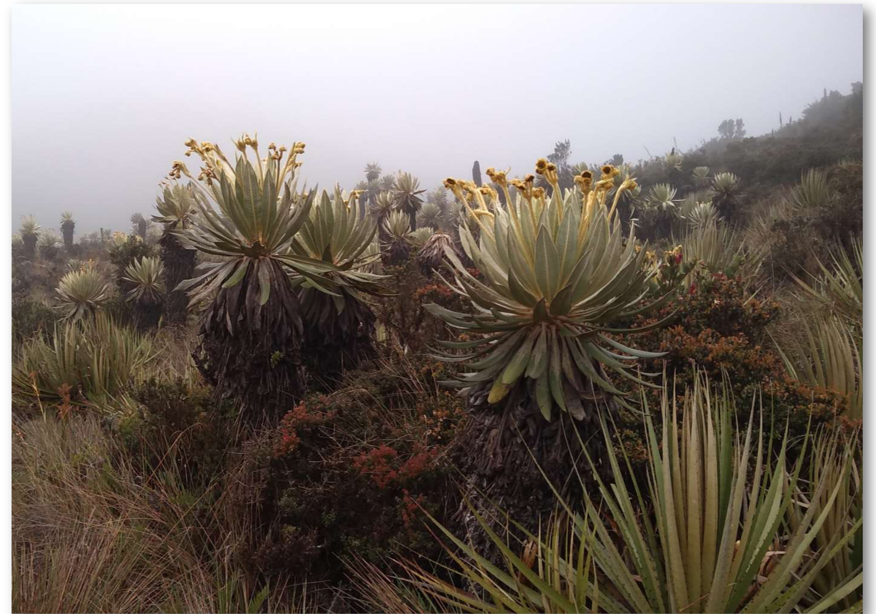
Figura 1. – panorámica del Páramo el Bijagual.

RESUMEN: Este trabajo tiene como principal objetivo hacer un estudio acerca del proceso de delimitación del páramo El Bijagual. Vamos a investigar acerca de los principales inconvenientes que han dificultado este proceso y buscaremos soluciones al respecto. Dentro del marco legal tendremos muy presente el Acuerdo No. 08 del 28 de Junio de 2017 por medio del cual se declara, reserva, delimita y alindera el Distrito Regional de Manejo Integrado (DRMI) páramo Mamapacha y Bijagual en los municipios de Garagoa, Chinavita, Ramiriquí, Tibaná, Ciénega y Viracachá, en la jurisdicción de CORPOCHIVOR. En este proceso tendremos la opinión de los campesinos y demás habitantes aledaños al páramo. Asimismo tendremos en cuenta a autoridades gubernamentales como la Alcaldía Municipal y la CAR Corpochivor.