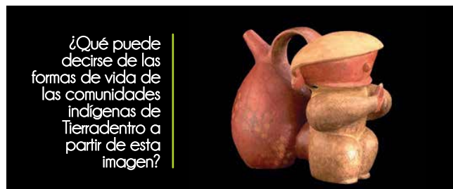
Alcaraza silbante - Tierradentro. Museo del Oro en línea (junio de 2015). http://www.banrepcultural.org/museo-del-oro/patrimonio-arqueologico

4 Realiza un análisis sobre los bienes de la cultura (verbal y no verbal) de la región, del país y del mundo para construir significados del entorno. Por ejemplo: