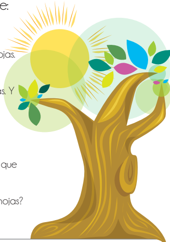
Fernando A. (1989). "El árbol que no tenía hojas"

2 Reconoce que las palabras tienen raíces, afijos y sufijos y las usa para dar significado a nuevas palabras. Por ejemplo: