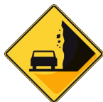
ZONA DE DERRUMBE

11 Planea sus escritos a partir de dos elementos: Qué quiero decir y para qué lo quiero decir ? Por ejemplo: