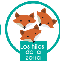
Los hijos de la zorra