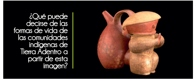
Alcaraza silbante- Tierra adentro. Museo del oro en línea (junio de 2015). http://www.banrepcultural.org/museo-del-oro/patrimonio-arqueologico

4 Realiza un análisis sobre los bienes de la cultura (verbal y no verbal) de la región, del país y del mundo para construir significados del entorno. Por ejemplo: